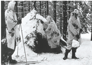
Winterkampf: Soldaten bauen eine Behelfsunterkunft.