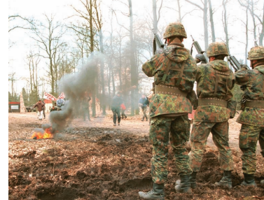
Soldaten sind mit aufgebrauchten Zivilisten konfrontiert.