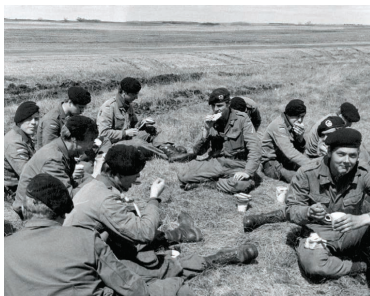
Truppenübungsplatz Shilo: In einer Ausbildungspause wird verpflegt.