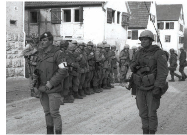
Bommland: Ein Jägerzug bereitet sich auf den Ortskampf vor.

Mit der Wiedervereinigung änderte sich auch das Übungskonzept der Bundeswehr wie der in Deutschland verbliebenen Nato-Truppen. Die Truppe führte größere Ausbildungsvorhaben und Gefechtsübungen fast ausschließlich nur noch auf Truppenübungsplätzen durch. Dabei stand die Ausbildung auf Kompanie- und Bataillonsebene im Vordergrund. Allerdings wird die übende Truppe vor allem durch unsinnige Umweltschutzvorschriften nunmehr schon auf Truppenübungsplätzen immer stärker in ihrer Handlungs- und Bewegungsfreiheit behindert. In Gefechtsübungszentren kann den Soldaten jedoch durch modernste Technik noch eine recht kriegsnahe Ausbildungssituation vermittelt werden. Seit Mitte der neunziger Jahre bildet indes die Ausbildung für Auslandseinsätze den Schwerpunkt. Bevor eine Einheit in den Einsatz geschickt wird, durchläuft sie eine etwa sechsmonatige Einsatz-Vorausbildung. Dabei bilden Patrouillen, Konvoibegleitung und das Betreibung von Check-Points sowie Unterrichte zur Landeskunde und Einsatzgrundsätzen den Schwerpunkt der Ausbildung. Das unerlässliche Training der Stäbe findet vorwiegend in sogenannten Rahmenübungen statt.