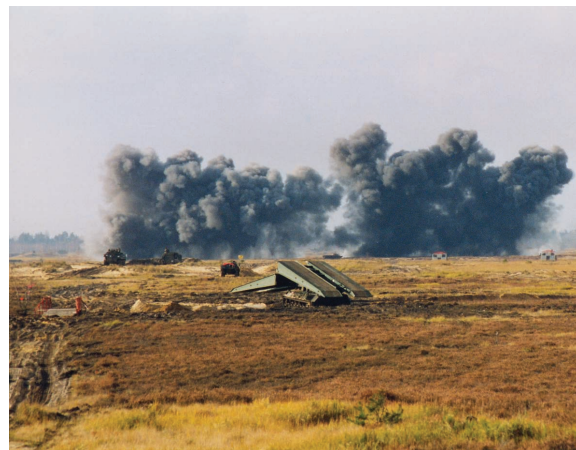
Die Artillerie schießt Sperrfeuer.