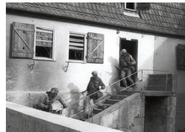
Häuserkampf: Ein Sturmtrupp erobert ein Bauerngehöft.