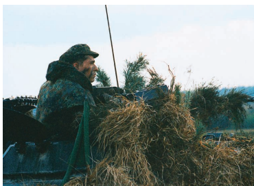
Gut getarnt beobachtet ein Vorposten das Gelände.