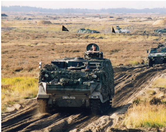
Eine Artillerieeinheit auf dem Truppenübungsplatz Oberlausitz.