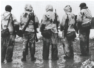
Auf der Schießbahn: Das nächste „Rennen“ wartet schon.