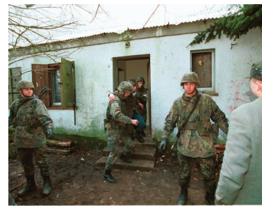
Vorausbildung für den Auslandseinsatz: Ein Verwundeter wird geborgen.