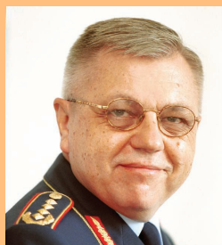
General (Lw) Harald Kujat 2000 bis 2002