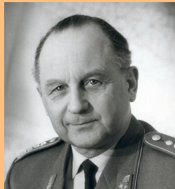
General Heinz Trettner 1964 bis 1966