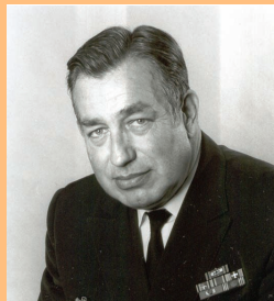
Admiral Dieter Wellershoff 1986 bis 1991