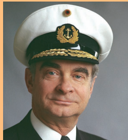
Admiral Armin Zimmermann 1972 bis 1976 (†)