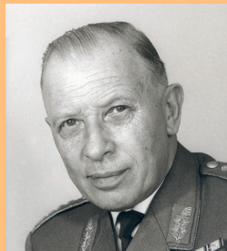
General Adolf Heusinger 1957 bis 1961