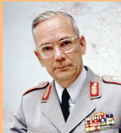
General Ulrich de Maizière 1966 bis 1972