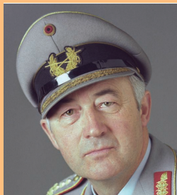
General Wolfgang Altenburg 1983 bis 1986