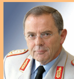
General Wolfgang Schneiderhan Seit 2002