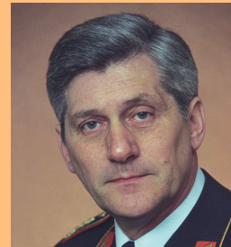
General (Lw) Harald Wust 1976 bis 1978