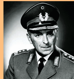
General Friedrich Foertsch 1961 bis 1963