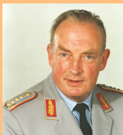
General Hans-Peter von Kirchbach 1999 bis 2000