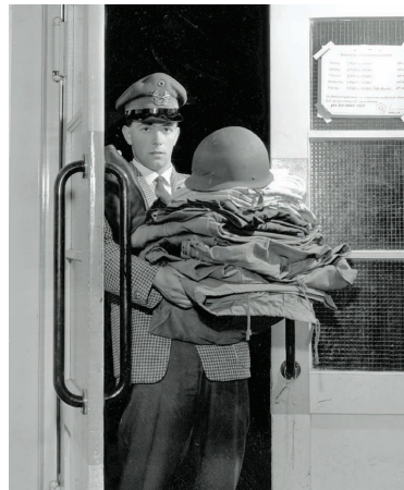
Der junge Soldat ist eingekleidet.

Die ersten Wochen in der Bundeswehr prägten den Gesamteindruck, der später kaum noch zu revidieren war. Das Auftreten der Unteroffiziere und Stabsunteroffiziere, die täglich unmittelbar mit den jungen Rekruten zu tun hatten, war entscheidend. Sie vermittelten die ersten Bilder vom Soldatsein – positive, wie negative. Bis heute gilt: „Beim Bund“, wie der Dienst bei der Bundeswehr umschrieben wird, beginnt eine andere Welt. Viele Jugendliche fürchteten den Wehrdienst.