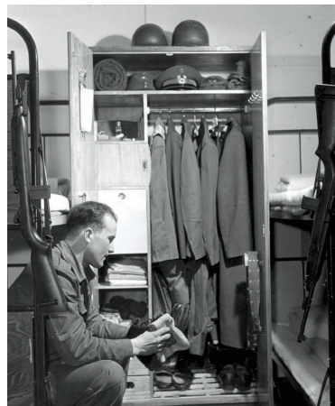
Der Spind ist vorschriftsmäßig eingerichtet.