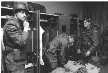
Fertigmachen zum Dienst: Auf der Stube wird „gerüdel“.

Die Bundeswehr war knapp ein Jahr alt, als am 1. April 1957 die ersten 9773 Mann des Jahrgangs 1937 als Wehrpflichtige einrückten. Ihre Altersgenossen, die ein oder drei Jahre älter waren, wurden als „weiße Jahrgänge“ nicht eingezogen. Die Wehrpflichtigen von 1957 kamen - von Ausnahmen abgesehen - nicht gerne „zum Bund“. Viele von ihnen sahen mit dem Aufbau der Bundeswehr eine neue Kriegsgefahr heraufziehen. Die Schrecken des Zweiten Weltkrieges wie die Bombenangriffe, Gefallenen- und Vermisstennachrichten sowie Flucht und Vertreibung hatten sie damals als Kinder selbst miterlebt.