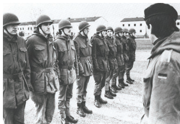
Eine Gruppe Rekruten ist zur Formalausbildung angetreten.

Das Bild des Soldaten war infolge des verlorenen Krieges natürlich oft negativ. Aber auch die neue Wehrgerechtigkeit spielte eine Rolle. Nur ein Teil der zum Wehrdienst heranstehenden jungen Männer wurde einberufen. Sie „dienten, während die anderen verdienten“, so hieß es nicht zu Unrecht. Dieses Verhältnis war in einer Zeit, in der die materiellen Wünsche schon oben an standen, schwer zu ertragen. Der stei-