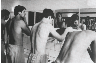
Nach dem Wecken erfolgt die Morgenwäsche.