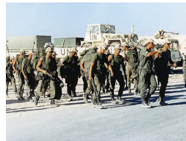
Soldaten auf dem Weg zum Konvoi-Einsatz.