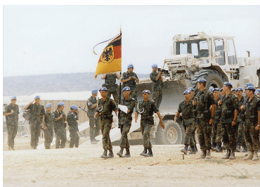
Mit einer Parade startet das deutsche UN-Kontingent den Somalia-Einsatz.