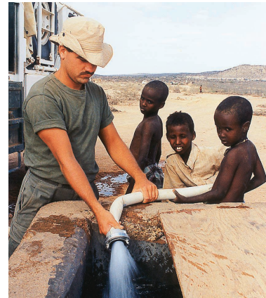
Die Wasserversorgung ist lebenswichtig.

Fazit: Der Somalia-Einsatz glich eher einem dilettantischen Abenteuer - ein Ruhmesblatt indes war er mitnichten.