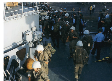
Die Blauhelm-Soldaten verlassen Somalia.