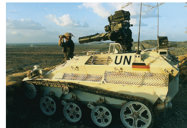
Ein „Wiesel“ in der somalischen Steppe.