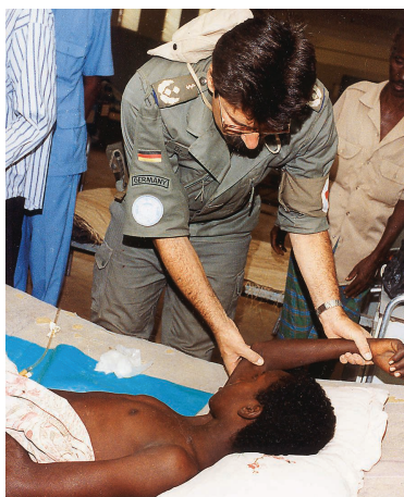
Ein Oberfeldarzt behandelt einen somalischen Jungen.